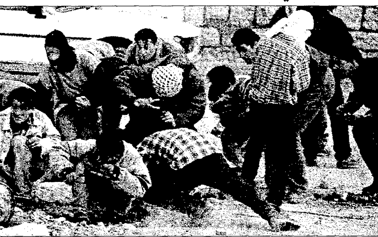
فلسطينيون يرون فرات الاحتلال بالحجارة أثناء مظاهرات أحياء الذكرى الثانية والعشرين ليوم الأرض

وقالت النعوى أن وزير الإعلام استغل منصبه وصلاحياته في إصدار لائحة مالية إجرامية لتقييد حرية الصحافة وتقييد حرية الإصدار الصحافي والرسائل الصحافية الخارجية، والتدخل في الشؤون في الأنظمة للحامسة للصحف والكتاب الإعلامية، ويرجع سعيه لرفع النعوى بسبب فشل محاولات كثيرة لإجرامها مع نقابة الصحفيين لثبني القضية، وقال أن رفع النعوى لا بد منها قبل القضاء الفعالة للقانونية لممارسة الاعتراض عليها، جدير بالذكر أن وزير الإعلام اليمني أصدر قراراً وزارياً في 3 آذار (مارس) الجاري بشأن اللائحة المالية لقانون الصحافة فرض مبالغ مالية كبيرة لإصدار الصحف أو تجديد تراخيصها وكذا فرض مبالغ على المرسلين الصحفيين لوسائل الإعلام الخارجية.